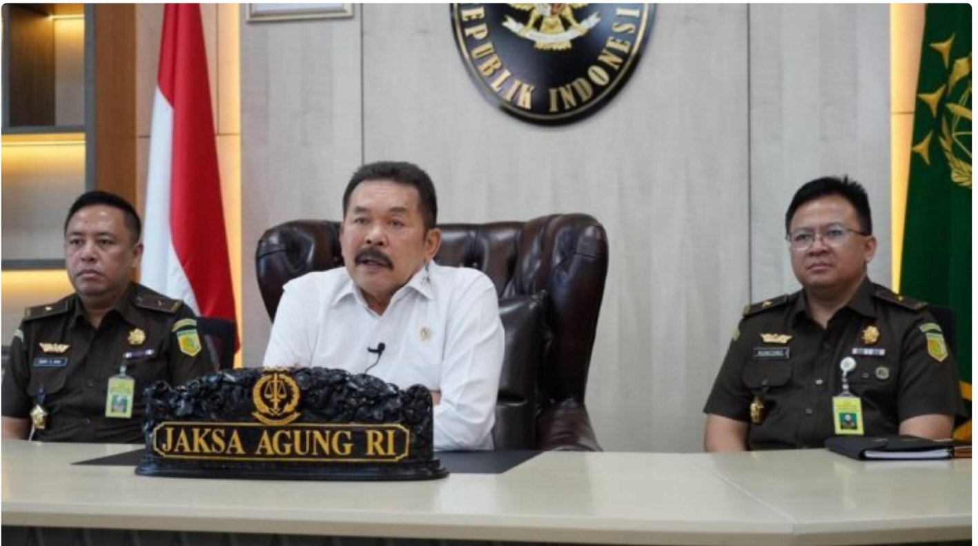
Jaksa Agung, Burhanuddin